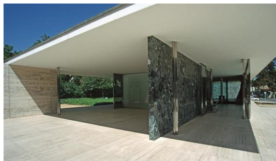
4B. Mies van der Rohe: Pabellón de Alemania en la Expo de Barcelona. 1929.