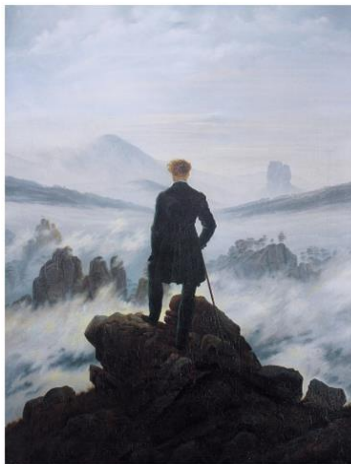
3A. C.D. Friedrich. Caminante sobre el mar de nubes , 1817.