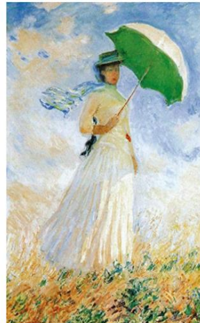
3B. C. Monet, Mujer con sombrilla girada a la derecha , 1886.